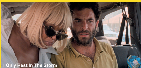
I Only Rest In The Storm

Das Fest der Kölner Kinos, Film-Festivals und -Initiativen startet im Filmhaus mit „I Only Rest In The Storm“, Pedro Pinhos episches, schillerndes Panorama vom Leben in einer modernen afrikanischen Metropole: Der Portugiese Sergio soll dort für eine NGO die Folgen eines großen neuen Straßenprojekts bewerten. Doch bald schon interessiert er sich mehr für die Femme fatale Diara und deren queeren Freund Gui. Neben der Premiere von „Zusammen ist man weniger getrennt“ des Kölner Filmemachers Alexander Conrads gibt es Beiträge vom Filmnetzwerk LaDOC und dem Institut français Köln sowie zum 30. Geburtstag des Kölner Filmverleihs REAL FICTION. Und den Abschluss bildet am Sonntag ein Abend zu Ehren von Alexander Kluge – mit seinem ersten und seinem letzten Langfilm (28.–31.5.)